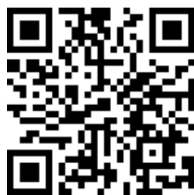
【水電線上申請系統】